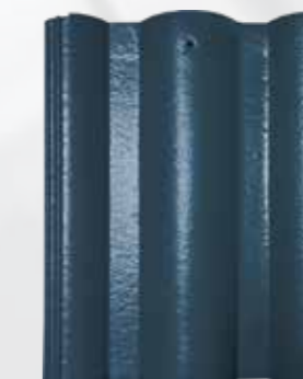
L507 - New Sapphire Blue

LƯU Ý Quý khách vui lòng liên hệ với bộ phận bán hàng để được tư vấn mua hàng đối với màu này.