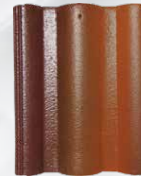
L204 - Sandstone