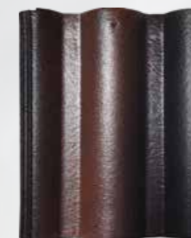
L207 - Garnet