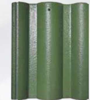
L505 - Jade