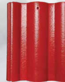
L102 - Red