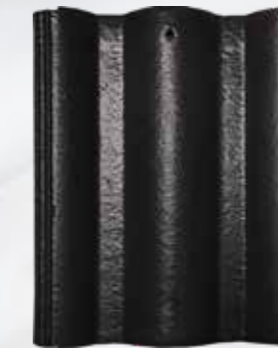
L104 - Charcoal