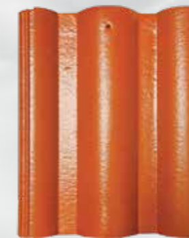
L101 - Carnelian

Do kỹ thuật in ấn nên màu sắc có thể sai lệch so với thực tế. Xin quý khách tham khảo mẫu thực tế.