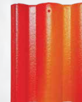
L201 - Gold