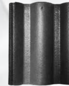
L226 - New Granite