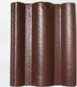
L108 - Bistre