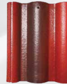
L203 - New Ruby